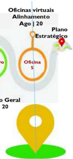
Figura 1-Figura 1 – Cronograma dos Encontros e Oficinas para elaboração do Planejamento Estratégico